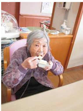
フルーチェ風プリン